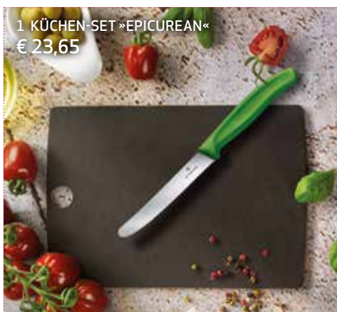
1 KÜCHEN-SET »EPICUREAN« € 23,65