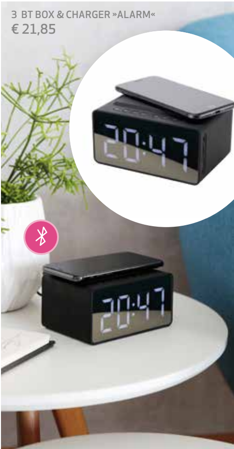
3 BT BOX & CHARGER »ALARM« € 21,85