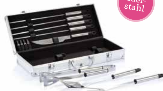
3 GRILLKOFFER € 37,75