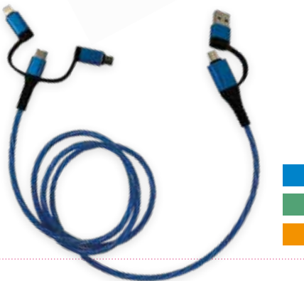
3 SCHNELL-LADEKABEL »5-IN-1 ALU FLOW LED« € 16,05