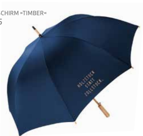
1 GASTSCHIRM »TIMBER« € 10,95