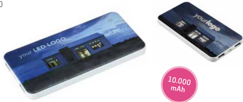
2 POWERBANK »LIGHTSHOW« € 23,90