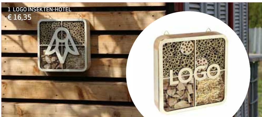
1 LOGO INSEKTEN-HOTEL € 16,35