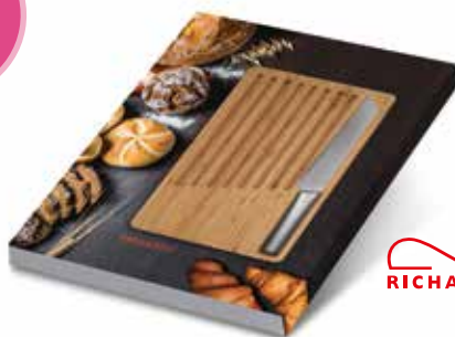
6 SCHNEIDSET »BREAD CUT AND BRUNCH« € 19,95