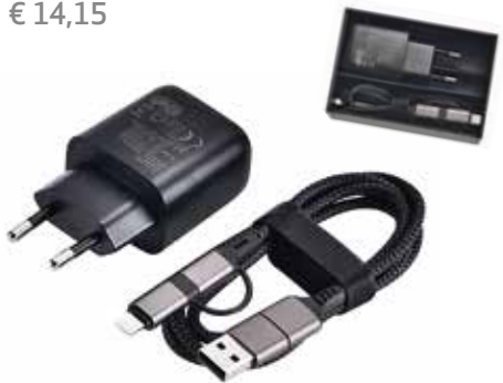
5 CHARGER-SET »PD POWER« € 14,15