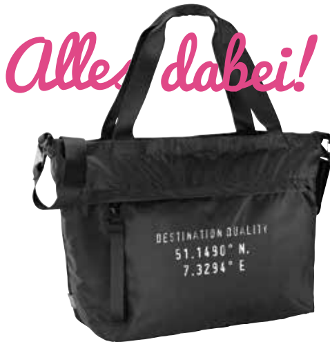
4 SCHULTERTASCHE »KINGSTON« € 23,95