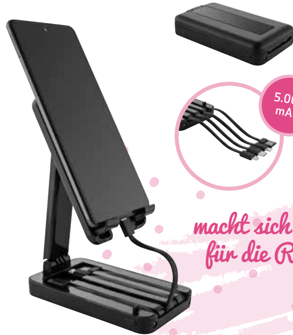
4 POWERBANK »PRESENT & TRAVEL« € 12,75