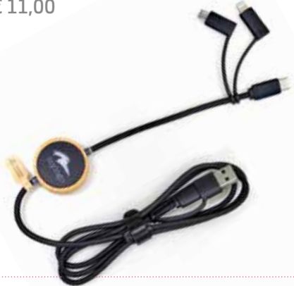
1 RPET LADEKABEL »5-IN-1 BAMBUS« € 11,00