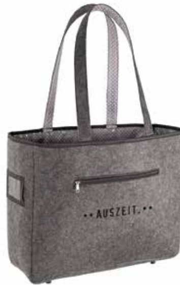
2 FREIZEITTASCHE »SPA« € 19,95