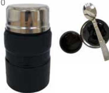
8 LUNCHPOT »TRAVEL« 0,5 L € 13,90