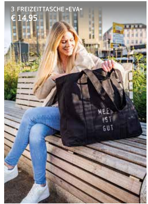
3 FREIZEITTASCHE »EVA« € 14,95