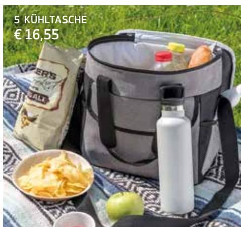
5 KÜHLTASCHE € 16,55