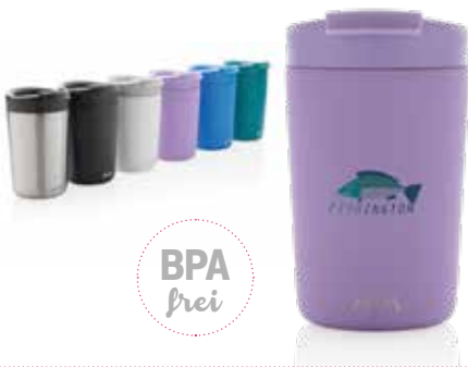
1 AVIRA RCS EDELSTAHLBECHER 0,3 L € 21,55