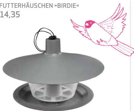
3 FUTTERHÄUSCHEN »BIRDIE« € 14,35