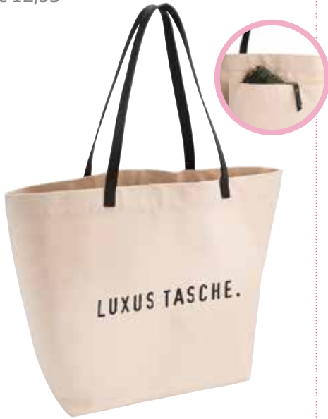
1 FREIZEITTASCHE »ANNA« € 12,95