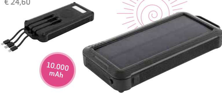
5 SOLAR-POWERBANK »PRO INDUCTION« € 24,60