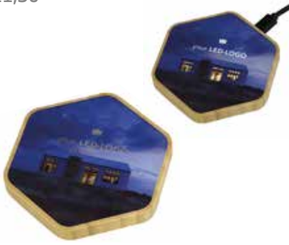
1 CHARGER »LOGO« € 11,30