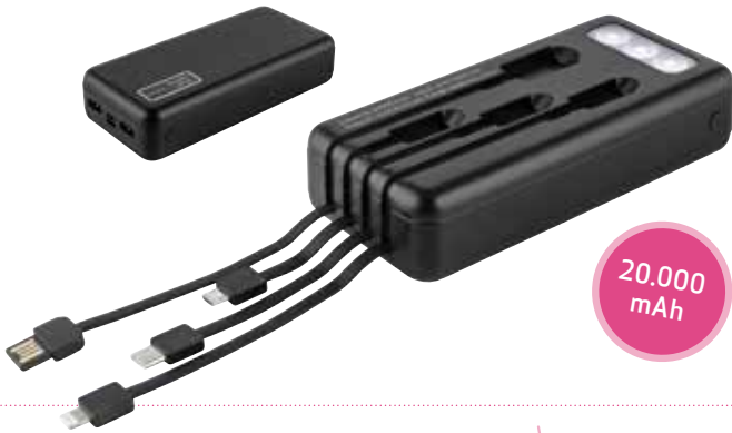
3 POWERBANK »THE BIG BLOCK« € 22,50