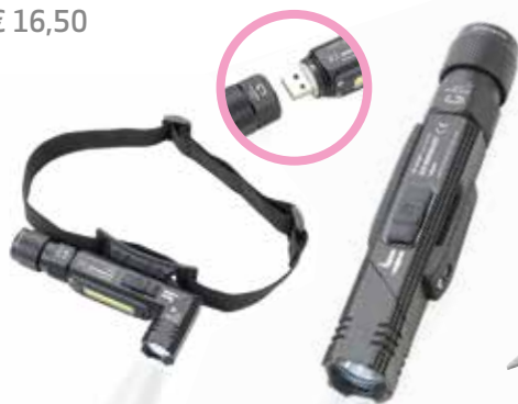
1 TASCHENLAMPE »KNICKLICHT« € 16,50