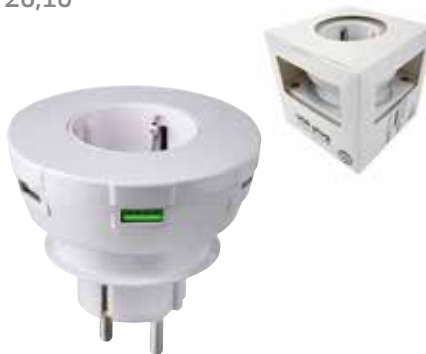
6 USB PD STECKDOSEN ADAPTER € 26,10